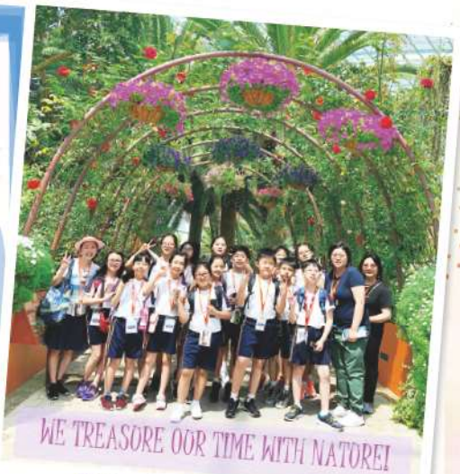
Group photo with teachers

On the final day, we saw the Merlion son. Unfortunately, we couldn't see the famous Merlion mother because she was under repair. That doesn't matter, because it was still a great day!