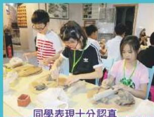
同學表現十分認真