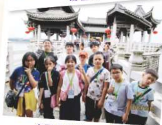
名不虛傳的廣濟橋