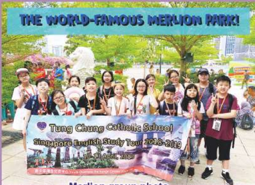
Merlion group photo