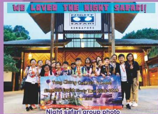
Night safari group photo