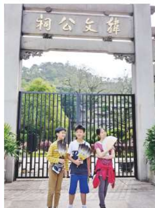
韓文公祠文人雅士多