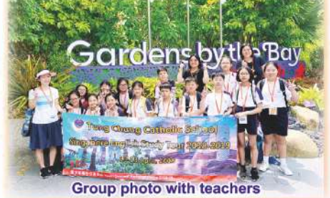
Group photo with teachers